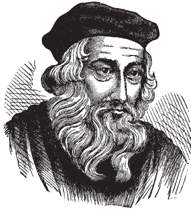
Джон Уиклиф (1321–1384)

Уиклиф получил либеральное образование, но страх Господень означал для него начало мудрости. В колледже он был известен своим ревностным благочестием, выдающимися способностями и основательными познаниями. В своем ненасытном стремлении к знанию он старался познакомиться со всеми отраслями наук. Он изучал схоластическую философию, гражданское и церковное право, особенно законы своей страны. В его последующих трудах чувствовалось влияние полученного образования. Основательное знание умозрительной философии того времени помогло ему вскрыть ее слабости и заблуждения, а изучение гражданского и церковного права подготовило его к великой борьбе за гражданскую и религиозную свободу. Умело владея мечом Слова Божьего, он был также сведущ в гуманитарных